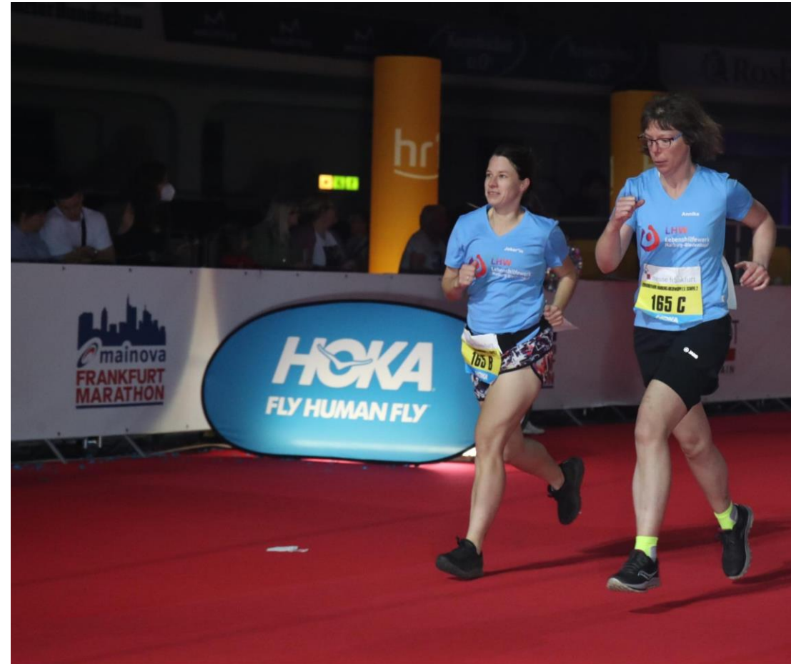
Frankfurt-Marathon, Oktober 2022