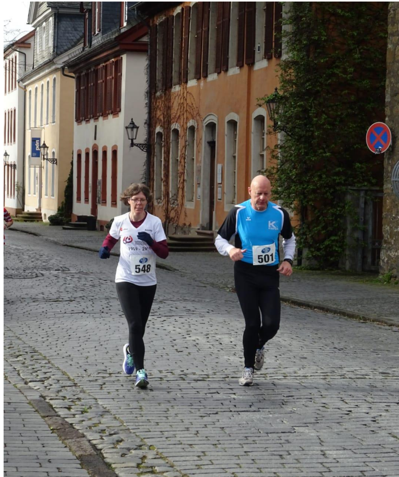
Stadtlauf Dillenburg, April 2023